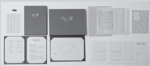
家系図、系譜、起源の案内等のオプション品が含まれた家系図セット