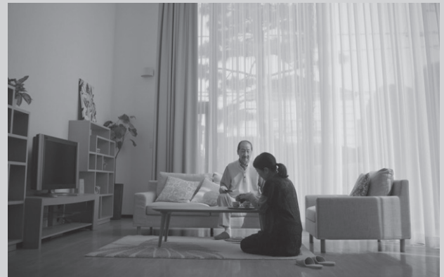
家系図の魅力伝えるために同社で制作するストーリー仕立てのショートムービーをYouTubeで公開している

ただ、家系図はけっして安価な商品ではなく、実物の家系図を見てから購入を考えたいという要望も多いことから、利便性の高い東京の中心地である東京・銀座に本社を構え、実際に家系図を見に来て相談できる来店型ショップとしている。